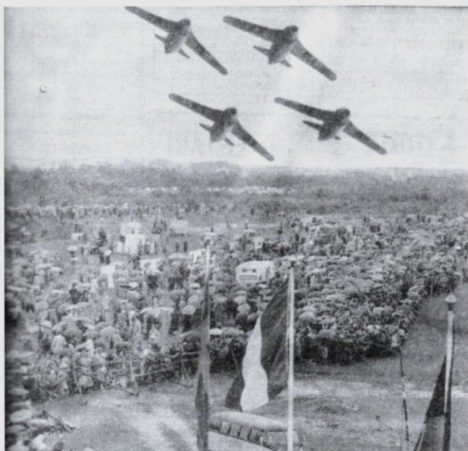
En avancerad gruppflygning av J 29 "Flygande tunnan" över en paraplyförsedd åskådarmassa på Jönköpings flygfält den 1 september 1957. Bildkälla Smålands Allehanda den 2 september 1957.

akrobatik av den högre skolan, utförd av Saab J 29 "Flygande tunnan".