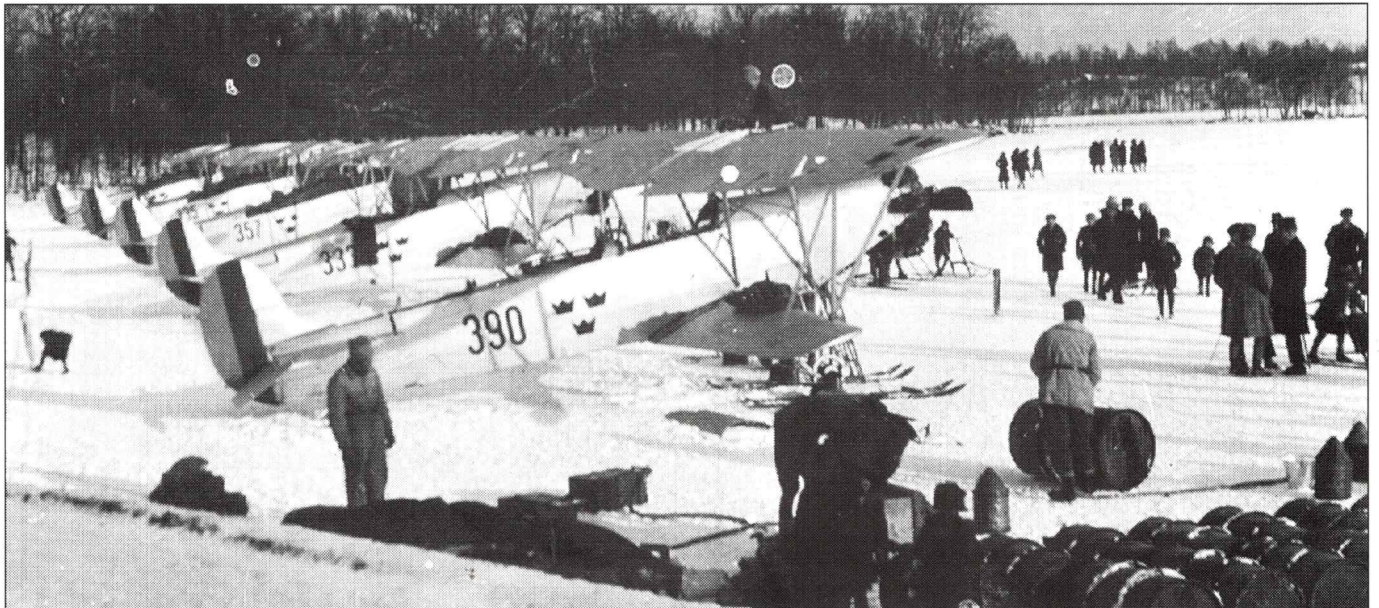
Sjöängen igen. Denna gång runt 1930. Fem Fokker CVE, med svensk militär beteckning S6, har ombaserats från F3 Malmen till Eksjö.