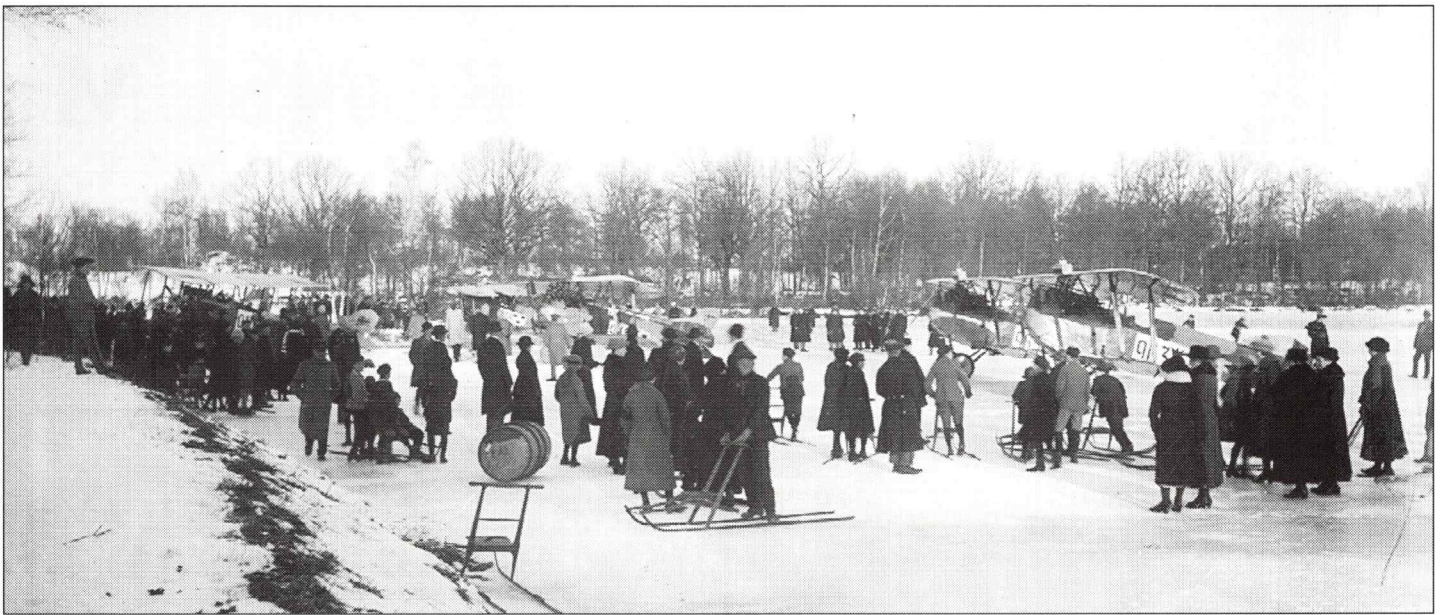
En avdelning från Flygkompaniet på Malmen besöker Sjöängen, tidigt 20-tal. På bilden syns tre Phönix-jagare, två Albatrosser samt en Tummelisa.