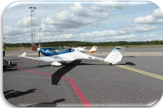
Elflygplanet OK-XXA 54.

Vid tillfället visades elflygplanet OK-XXA 54 med en flygtid på ca 2,5 h/ ca 30 mil.