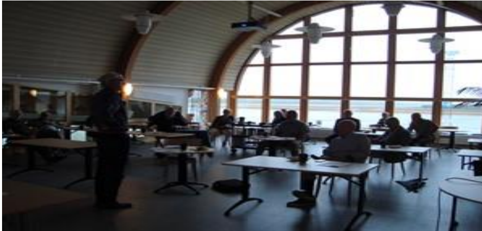
Föreningsstämman i ” Utsikten” på flygplatsen.

aktuella restriktioner. Under sommaren då antalet Covid-19 patienter minskade och minimal smittspridning förelåg beslutade styrelse att inom ramen för rådande restriktioner genomföra ett fysiskt möte på flygplatsen den 26:e augusti . Planen var att stämman skulle genomföras utomhus. Men på grund av rådande väderleksförhållande bestämdes att stämman kunde genomföras inomhus då det fanns tillgång till stor lokal (utsikten) på flygplatsen. så att stämman kunde genomföras ”Corona- säkrat” (max 50 personer) och rekommenderade avstånd kunde hållas. Föreningsstämman samlade 17 medlemmar.